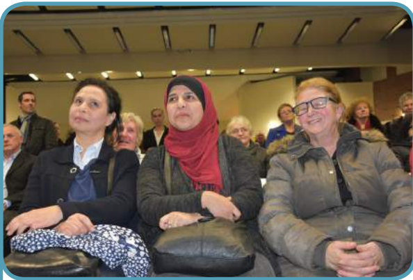
Des habitantes tout sourires pour une soirée conviviale

0.00058 % comme la part du budget de fonctionnement consacré à l'organisation de la soirée des vœux et des initiatives citoyennes 2016.