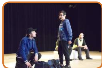
Sensibilisation tout en s'amusant avec le Théâtre de l'Opprimé

Avant une entrée en matière plus sportive, les jeunes des trois communes ont pu se rencontrer, et échanger lors d'un spectacle du « Théâtre de l'Opprimé » intitulé « Faute ! » : les comédiens ont fait participer les jeunes afin de les interpeller sur des sujets sensibles tels que le sexisme, le racisme et l'importance de pratiquer une activité sportive.