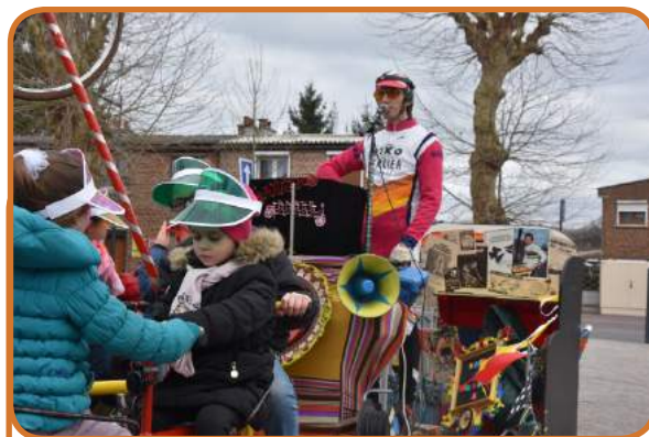
Un décor « seventies » avec le « Manège à pédales » !