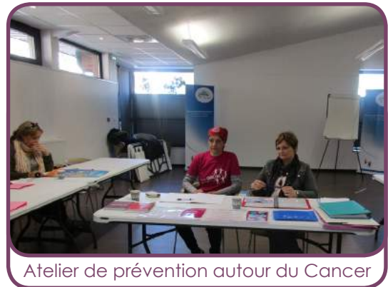
Atelier de prévention autour du Cancer

Depuis sa création en 2010, 85 000 jeunes se sont engagés dans cette démarche. La volonté de l'agence du Service Civique est de porter ce chiffre à 170 000 volontaires par an.