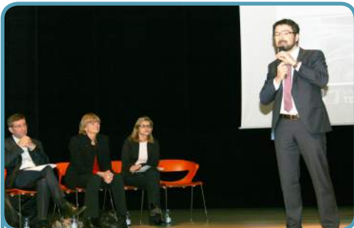
Valenciennes Métropole organisait une réunion publique pour les habitants du centre-ville en novembre 2015

Les modes de pratique des ménages en matière d'utilisation des outils numériques a modifié les politiques d'aménagement des territoires pour les acteurs publics locaux : en effet, nous sommes plus nombreux à utiliser, parfois simultanément, nos tablettes, smartphones et ordinateurs via le réseau ADSL, par le câble ou en réseau WIFI.