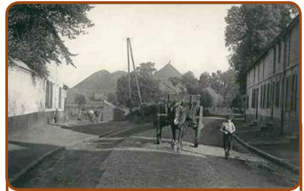
La rue Jean Jaurès pendant la guerre « 14-18 »

Le médecin militaire allemand Münsterer est en garnison à Valenciennes, il photographie les communes avoisinantes. Elles sont intitulées : « Beuvrages in der Nähe von Anzin »