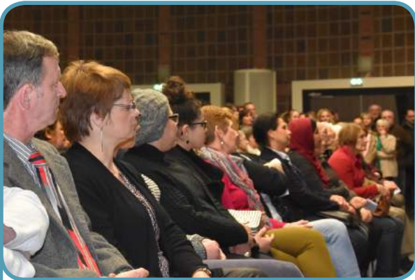
Le public a répondu en nombre, comme chaque année, à l'invitation de la municipalité