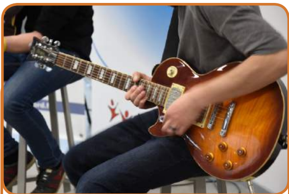
Du rock avec « The Anatol » en concert acoustique

Celle-ci fut jalonnée d'animations pour tous les goûts, uniques, originales et parfois révélatrices des futures actions qui vous seront dédiées dans ce lieu : des rencontres avec des échassiers - policiers verbalisateurs, en passant par quelques coups de pédales sur le manège à biclous, les visites d'un autre genre proposées par la Compagnie La Vache Bleue, l'ambiance intimiste des contes pour enfants avec les artistes de la Compagnie « L'éléphant dans le boa », et bien sûr, les conseils avisés des agents de la Médiathèque.