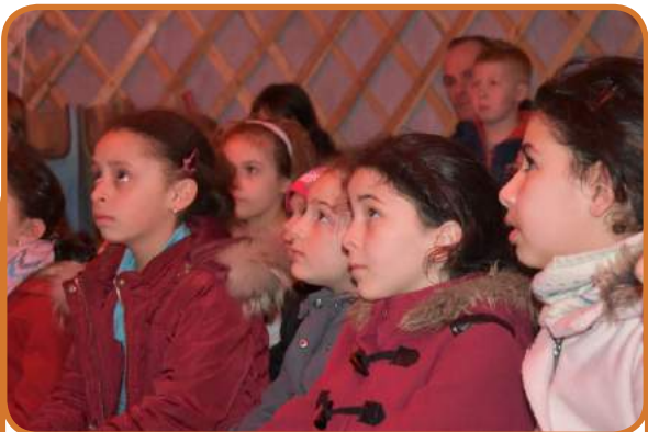
Un conte intrigant sous une yourte avec la compagnie « L'éléphant dans le Boa »