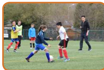
Du sport, du respect et de la solidarité pendant les rencontres de l'après-midi