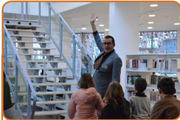
Visite décalée et pleine de fantaisie par la Compagnie « La vache bleue »