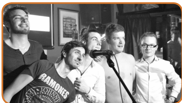
The Anatol, lors de leur premier concert ... avec d'autres musiciens

Trois jeunes soutenus par la commune et les partenaires du CLAP !