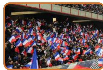
Ambiance au Stade du Hainaut lors de France - Ukraine

Cerise sur le gâteau pour l'ensemble des jeunes participants puisqu'ils ont pu assister ce soir là, à la rencontre internationale de football féminin opposant notre équipe nationale à celle de l'Ukraine dans le cadre des qualifications à l'Euro 2017 féminin.