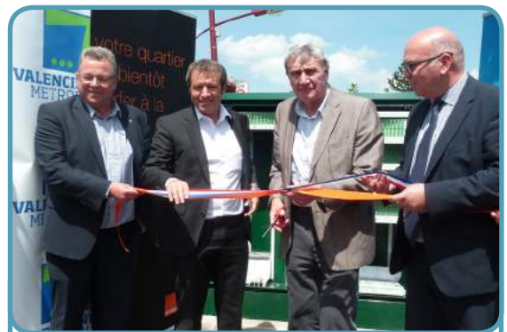
Inauguration de la première armoire Fibre Optique à Beuvrages le 28 juin 2015

La Fibre Optique s'intègre parfaitement dans le projet de rénovation urbaine de la commune en proposant un service moderne et adapté aux attentes des citoyens et à la volonté d'attirer de potentiels entrepreneurs dont le critère de l'accès Internet est devenu un des principaux besoins.