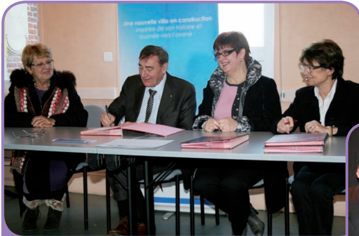
La Ville a signé, avec la CAF, le renouvellement de la convention contre les logements indécents - 7 décembre 2012 -