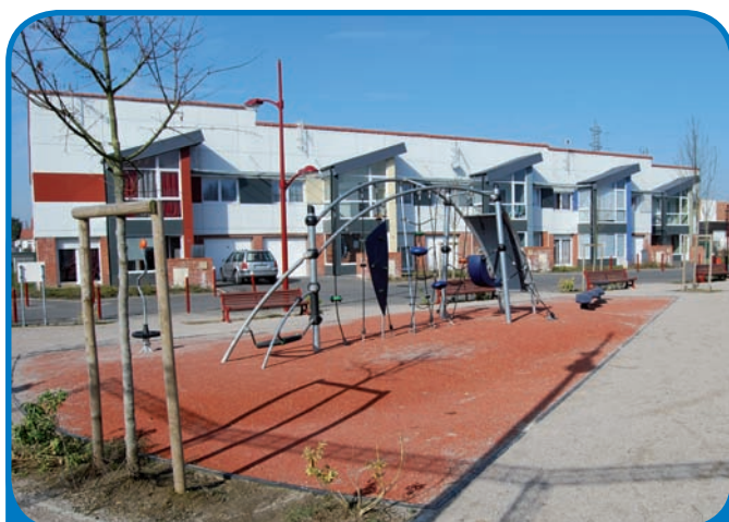
La transformation unique de la Résidence Château Mallet

Aujourd'hui, se promener dans la Résidence Château Mallet, c'est y découvrir :