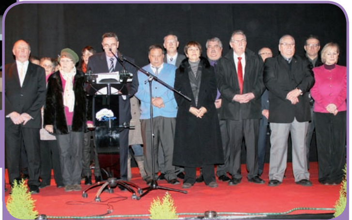
Cérémonie des Vœux de l'équipe municipale - 17 janvier 2013 -