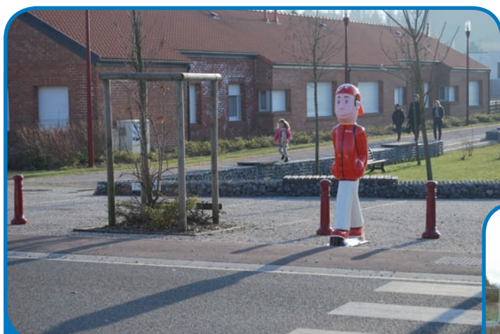
Arthur accompagne et veille désormais sur vos enfants sur le chemin de l'école, merci de le respecter !