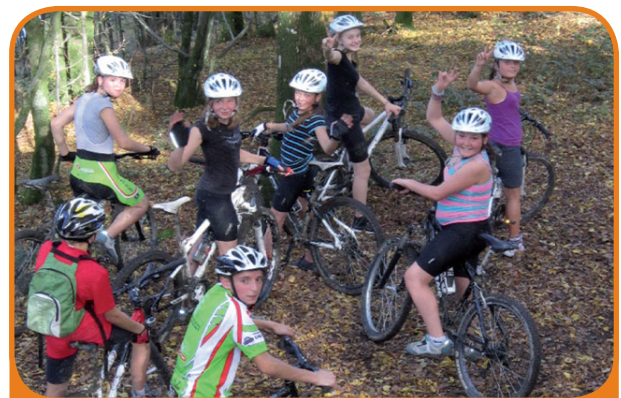
Des sorties VTT sont prévues pour la sixième sportive

- la sixième sportive permet au jeune , par le biais du foot ou du VTT, d'être bien dans son corps, bien dans sa peau. Grâce à un entraînement de qualité, et la participation aux compétitions, l'élève se dépasse dans l'ensemble de ses activités scolaires.