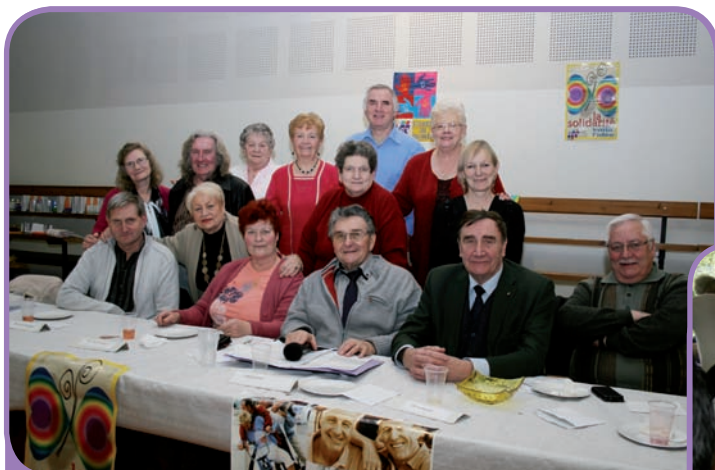
Assemblée Générale de l'Association Loisirs Solidarité Retraite - 2 mars 2013