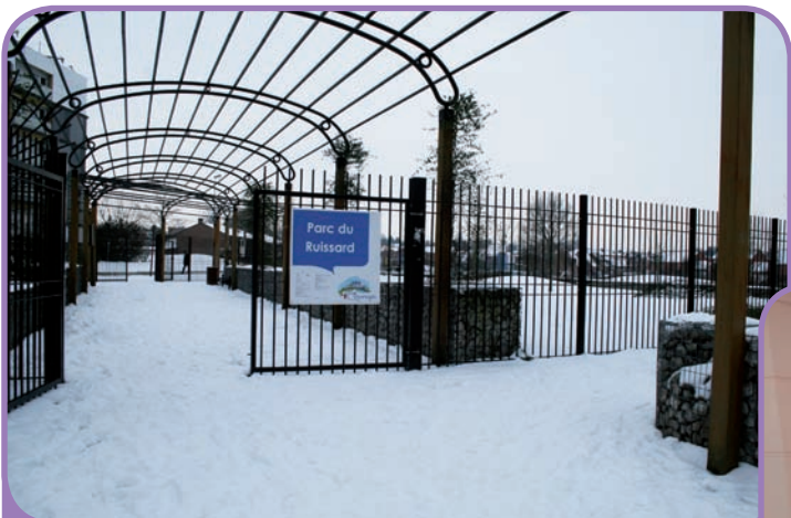
Beverages sous la neige le 17 janvier 2013