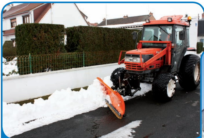
L'équipe de sablage et de déneigement (encore !) sur le qui-vive à quelques jours du printemps