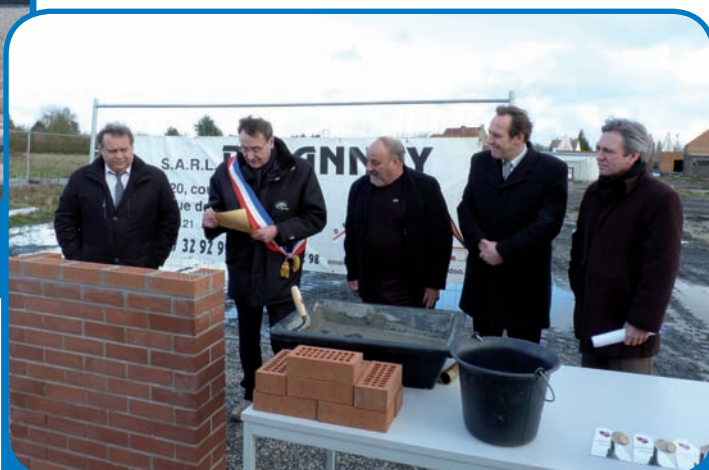
Pose de la première pierre le 30 janvier 2013 des locatifs Partenord Habitat - Résidence La Couture