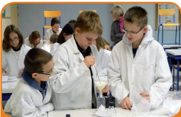
Des expériences et découvertes pour la sixième scientifique

Des sorties pédagogiques et un partenariat avec l'université de Valenciennes viennent approfondir les activités effectuées au collège.