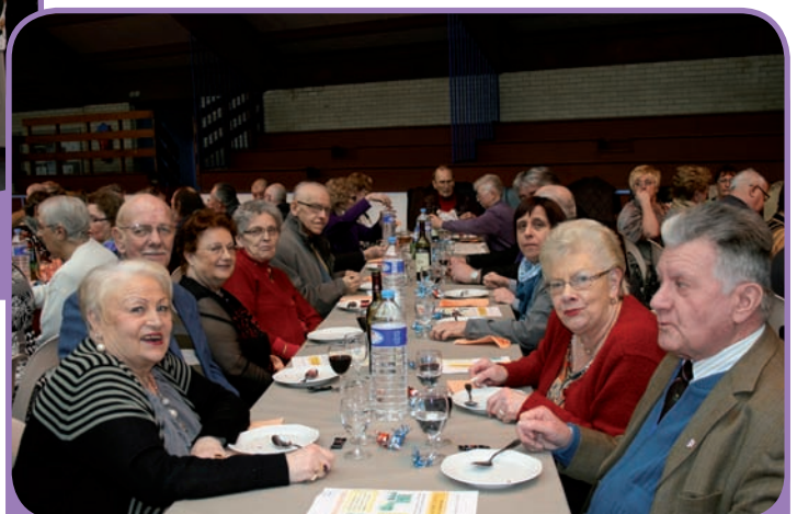
Goûter des Anciens - salle Pierre de Coubertin - 17 février 2013 -