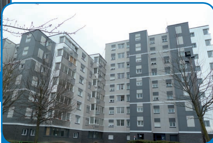
La Résidence Les Chardonnerets réhabilitée - mars 2013 -