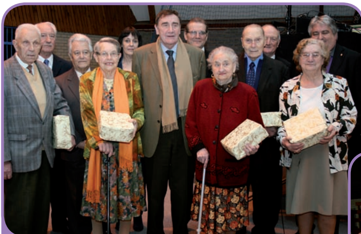
Goûter des Anciens - salle Pierre de Coubertin - 17 février 2013 -