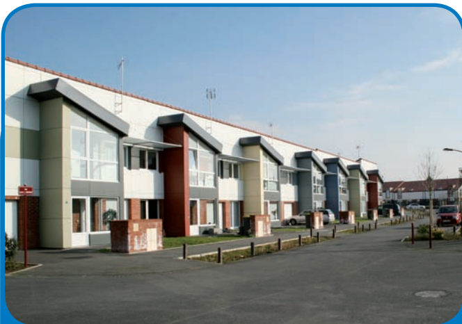
Les 42 nouveaux logements de la SA du Hainaut s'intègrent parfaitement dans le nouveau visage de la résidence et de la ville