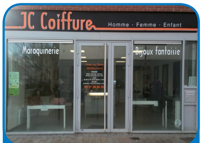
Le coiffeur de Beuvrages, nouvellement installé rue François Gressiez

Du chemin reste encore à faire avant la fin des travaux d'aménagement de la nouvelle Place. Mais bonne nouvelle : la destruction du "11 novembre" est prévue d'ici le deuxième trimestre 2013, avec l'arrivée de nouveaux commerces et habitants.