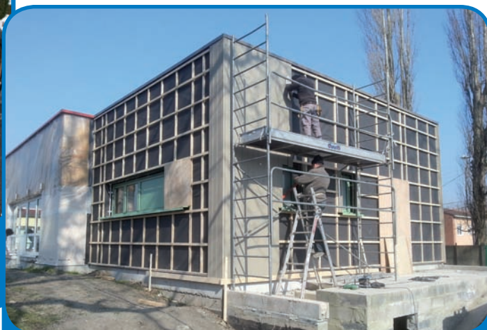
Travaux d'extension de l'école Joliot Curie Nouvelle salle de classe - mars 2013