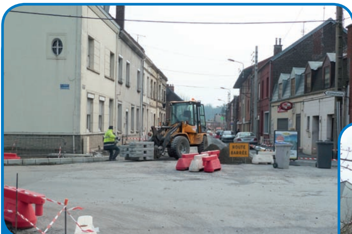
Les travaux de la rue Jean Jaurès occasionnent des déviations importantes