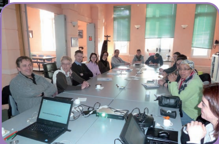
Elaboration du Projet Educatif Local - Ici, les ateliers thématiques sur le partenariat et la gouvernance du PEL 27 mars 2013