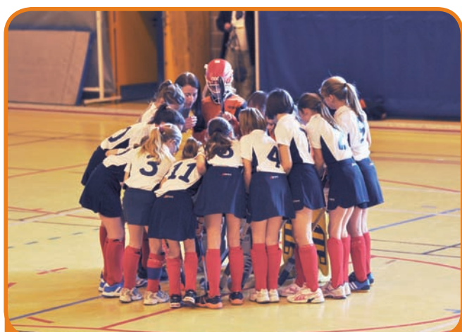
Le Nord champion, dans les catégories filles et garçons !