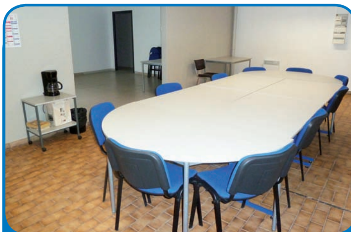
Le local C/1 des Chardonnerets a été réhabilité par le Centre Technique Municipal - janvier 2013 -