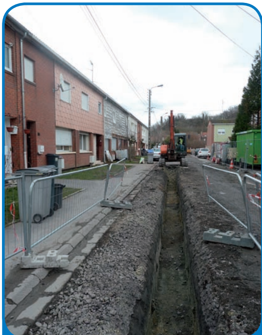
Les travaux d'assainissement concernant une partie de la Résidence Fénelon se poursuivent - mars 2013 -