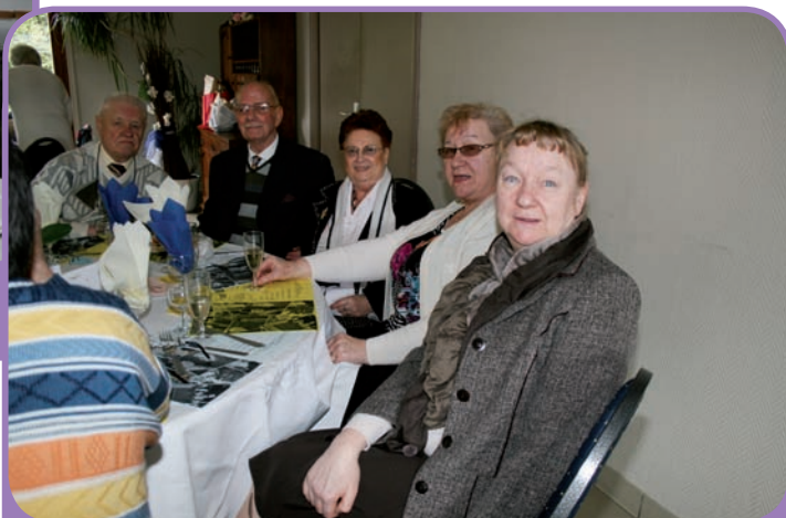
Repas de l'association "Education et Joie" - 3 mars 2013 -