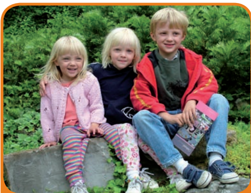
Le DRE, un outil pour vous aider, vous et vos enfants

Qu'elle concerne la scolarité (maîtrise de la langue parlée ou écrite, autonomie dans le travail), le comportement (repli sur soi, agitation, etc.), la santé de l'enfant (accès aux soins), ou le manque d'activités (pratique d'un sport ou loisirs), l'observation d'une fragilité permet d'activer le dispositif lorsque celle-ci constitue un frein à la réussite et à l'épanouissement de l'enfant.