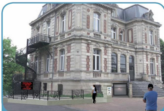
Une vue extérieure du projet - Le passage sous le perron sera condamné pour offrir plus d'espace aux administrés

Bien que le bâtiment ne présente pas de contraintes spécifiques, l'accès au service de l'Etat civil reste impossible pour les personnes à mobilité réduite.