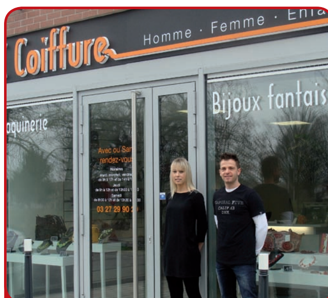
Une partie de l'équipe "JC Coiffure"

Nous avons déjà de bonnes retombées. Nous avons d'ailleurs dernièrement embaucher un "coiffeur homme" afin de satisfaire toute la clientèle ; nous serons alors 3 employés dans l'établissement, pour recevoir, avec ou sans rendez-vous, notre charmante clientèle.