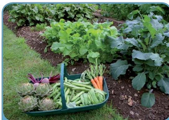
Les "Ateliers Jardins" ont repris le 2 avril 2013