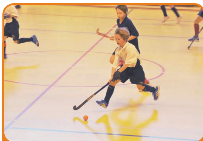
Des jeunes hockeyeurs en action