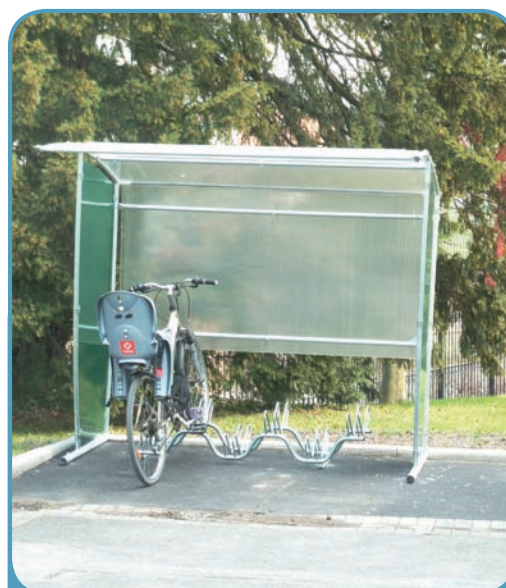
Un abri à vélo a été installé sur le parking de l'Hôtel de Ville