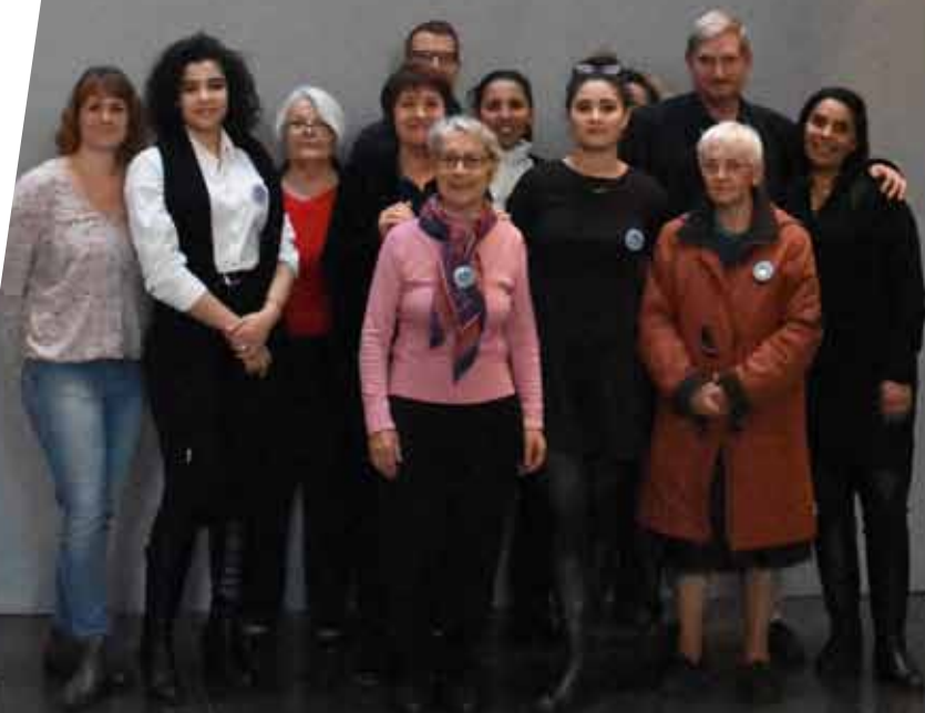
Conseil citoyen - Ville de Beuvrages - Invitation d'Emmanuel Macron, Président de la République - 14 novembre 2017 - Tourcoing