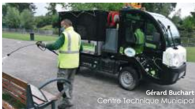
Gérard Bucharth Centre Technique Municipal

Afin d'éviter au maximum les contacts sociaux et ainsi ralentir la propagation du virus, plusieurs services ont fonctionné par roulement des agents . C'est ainsi que les agents du Centre technique Municipal, par exemple, ont assuré la pérennité des bâtiments et de la salubrité publique.