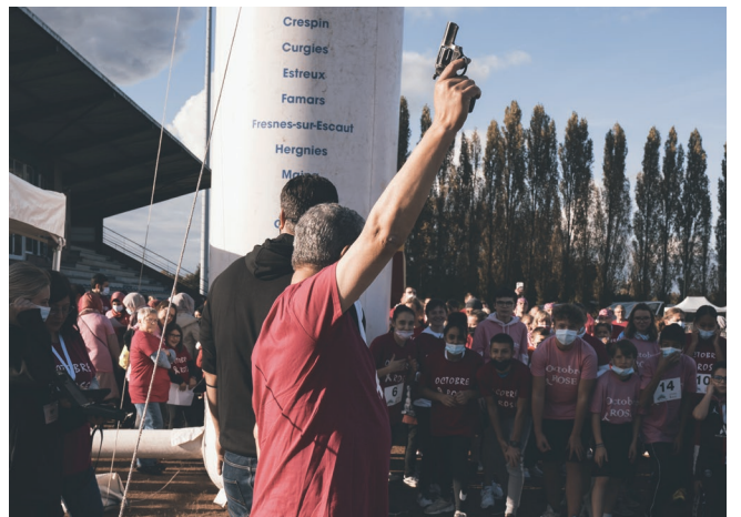
Samedi 23 octobre - 12 défis sportifs ont été réalisés en famille ou entre amis lors de ce parcours aventure de lutte contre la maladie.