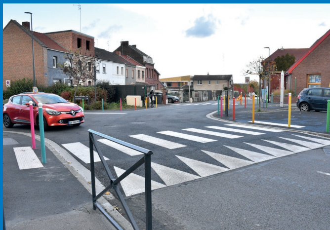
Plateau ralentisseur à l'angle des rues Gustave Delory et Georges Mortuaire.

En complément du radar pédagogique fixe installé dans la rue Emile Zola, à proximité de la Graineterie des Viviers, la Ville de Beuvrages vient d'acquérir deux radars pédagogiques mobiles . Ces derniers seront installés aux endroits stratégiques de la ville dans une démarche pédagogique de sensibilisation à la sécurité routière.