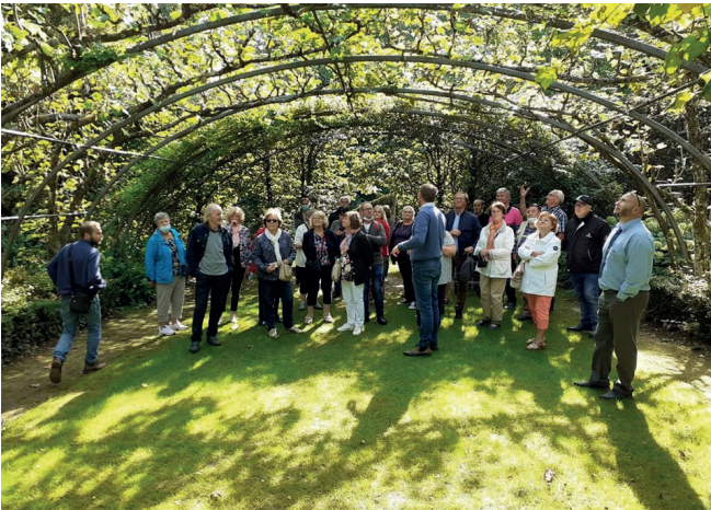
Du 20 au 23 septembre - Visite de la Ferme Dutemple et des Jardins de Séricourt, sensibilisation aux changements climatiques et découverte du patrimoine arboré de la commune ont rythmé cette semaine dédiée à l'environnement.