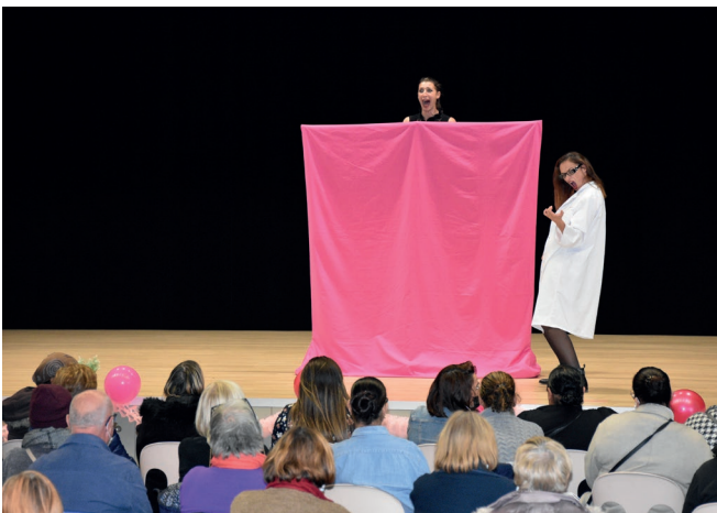
Judi 21 octobre - Spectacle - débat « Les dépisteuses » par la compagnie La belle Histoire dans le cadre d'Octobre Rose à Beuvrages