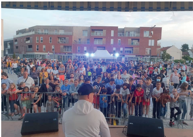
Vendredi 2 juillet - Place de la Paix - Fête de la musique à Beuvrages.