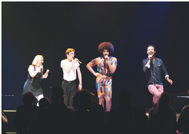
Mardi 13 juillet - Espace Dubedout - Concert « Et si on chantait » dans le cadre des traditionnelles festivités du 13 juillet