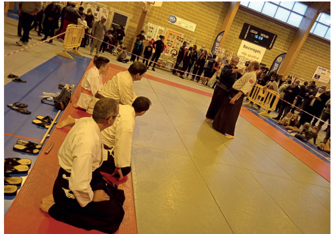
Samedi 2 octobre - Salle Léo Lagrange - Premier forum des sports à Beuvrages lors duquel les beuvrageois ont pu rencontrer nos associations sportives locales pour reprendre une activité sportive.