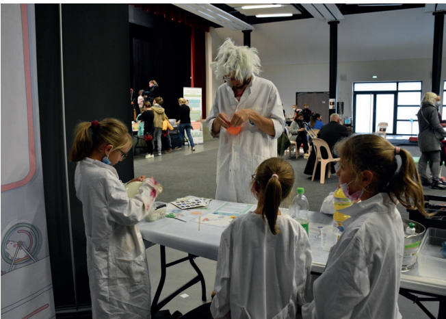
Mercredi 6 octobre - Tels de petits scientifiques, vous étiez nombreux/euses à participer à la première édition de la fête de la science à Beuvrages