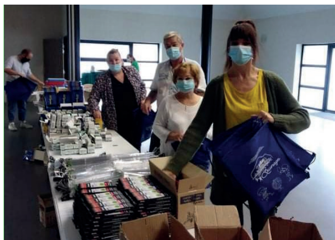
Les 30 et 31 août - Près de 500 kit de rentrée scolaire ont été distribués aux élèves des écoles élémentaires Paul Langevin et Jules Ferry.