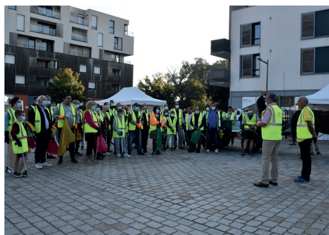
Samedi 18 septembre - Dans le cadre du World Clean Up Day, Beuvrages s'est mis au vert lors de cette balade propreté. Au total, 50 beuvrageois ont ramassé près de 84 kg de déchets en 3h.