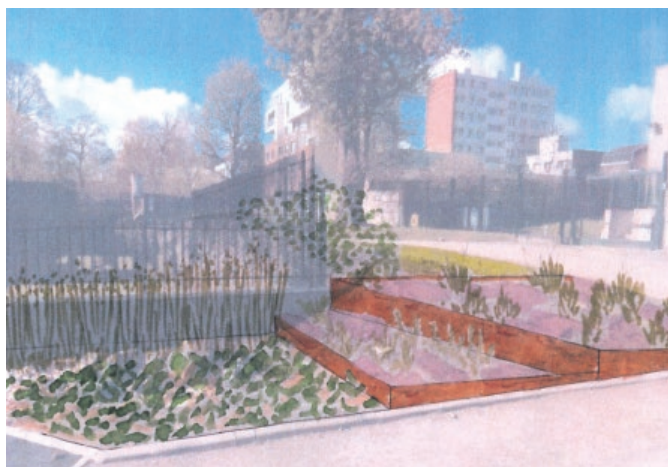
Esquisse du projet de végétalisation du cheminement Liberté.

La ville de Beuvrages a entrepris un vaste programme de végétalisation des espaces verts à différents endroits stratégiques de la ville. En 2021, dès la fin octobre, le projet se poursuit par le fleurissement de trois espaces , un en centre-ville et deux au sein du quartier du Ruissard :