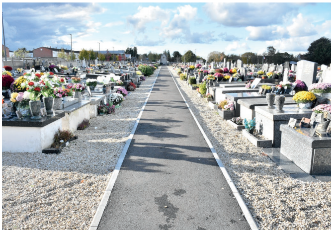
Le cimetière communal réaménagé désormais accessible à tous !

En 2020, le cimetière communal a été réaménagé pour permettre son extension dans la continuité de celle réalisée dans les années 90, par l' aménagement d'un espace cinéraire , par la mise en valeur de l' entrée rue du Docteur Carlier , par la création d'un abri de condoléance et de funéraille civile et par la minéralisation des allées principales de l'ancien cimetière.