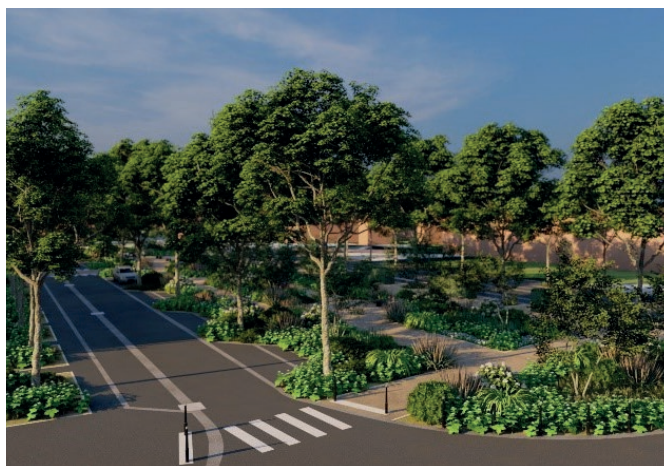
Esquisse du projet de renaturation de la Place Hector Rousseau

La Place Hector Rousseau, situé en hypercentre de la ville, a été dessinée en 2006 à la faveur du projet de rénovation urbaine. Située face à l'espace André Lenquette, à proximité des commerces, de l'Hôtel de Ville et du Parc Fénélon, elle n'est actuellement qu'un lieu de passage pourtant doté d'un véritable potentiel. C'est pourquoi cette place va être transformée en un square bucolique sécurisé, propice à la promenade dans la continuité des projets de revégétalisation entrepris depuis 2018 avec pour objectifs l'amélioration du cadre de vie des habitants et l'attractivité de la commune.