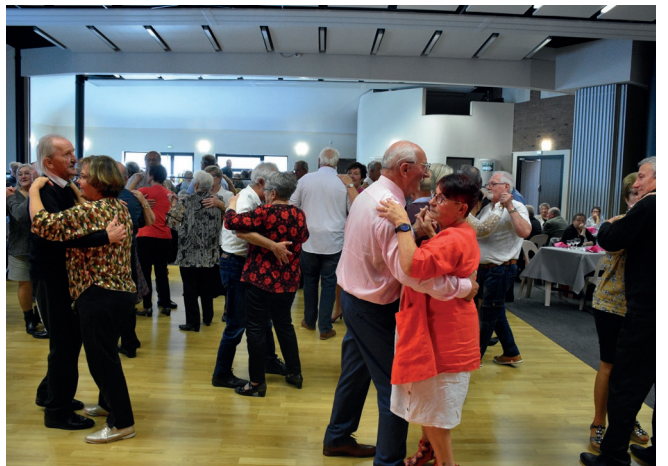
Du 11 au 17 octobre - Dans le cadre de la semaine bleue, les seniors beuvrageois lors du traditionnel banquet des aînés. Un moment de convivialité qui vous avait manqué !