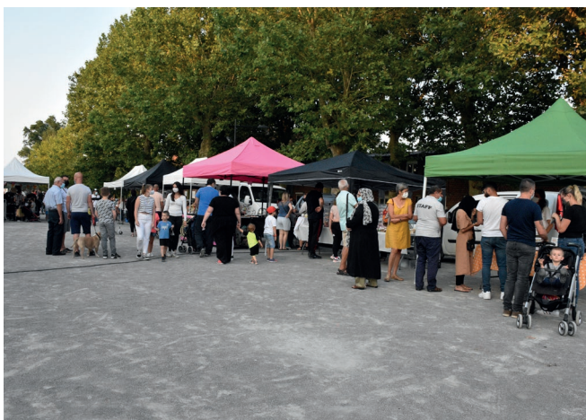
Vendredi 3 septembre - Centre-ville - Le premier marché nocturne de Beuvrages a accueilli près de 900 visiteurs venus à la rencontre des brocanteurs et artisans locaux.