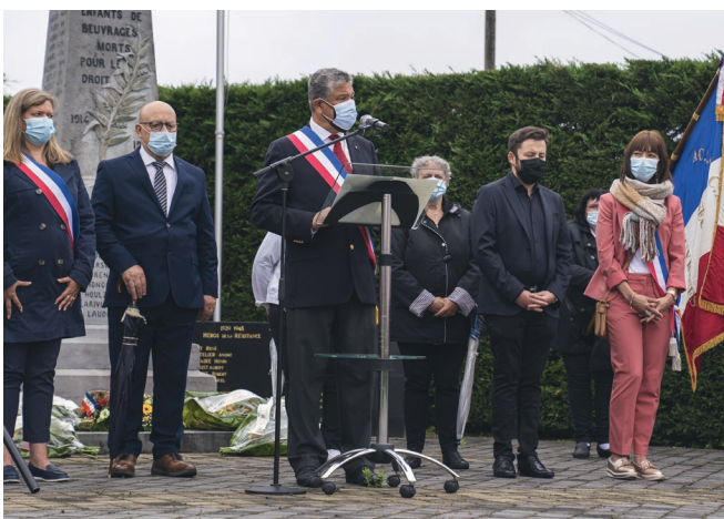
Mercredi 14 juillet - Monument aux Morts - Commémoration du 14 juillet lors duquel un hommage particulier a été rendu aux personnels soignants